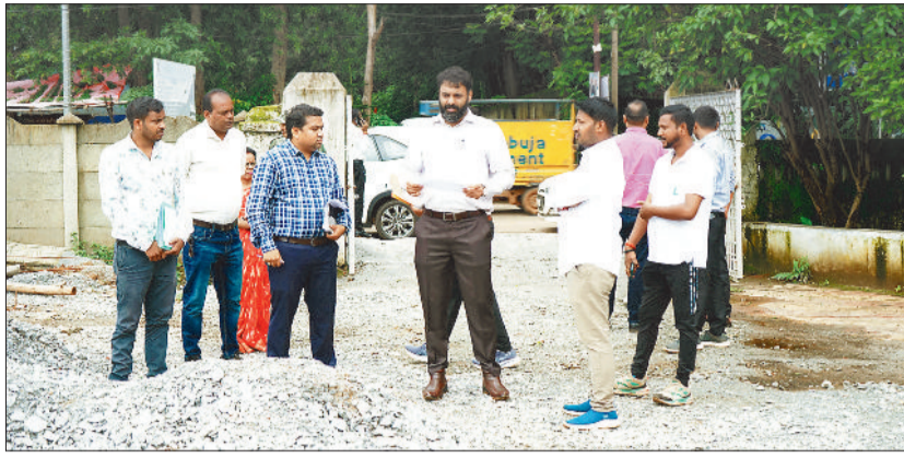
निर्माणाधीन अस्पताल परिसर का निरीक्षण करते कलेक्टर।

कार्य एजेंसी गृह निर्माण मंडल को बनाया गया है। कलेक्टर ने अधिकारियों को निर्देश दिए हैं और समय सीमा का विशेष ध्यान रखने के लिए कहा गया है। मुख्यमंत्री विष्णु देव साय ने माह 7 अप्रैल 25 को अस्पताल का भूमि पूजन