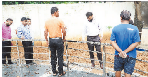
गुणवत्ता पर नाराजगी जाहिर करते कलेक्टर।