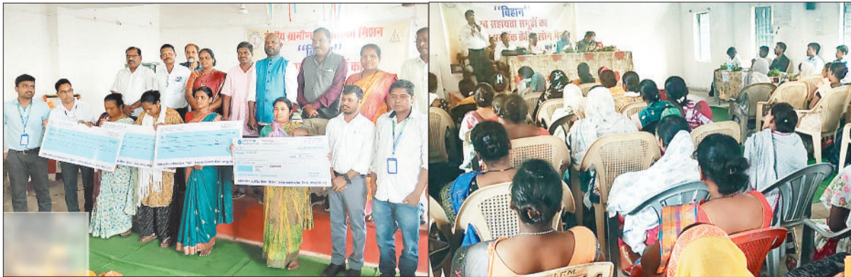
महिलाओं को मुद्रालोन का चेक प्रदान करते बैंक अधिकारी।