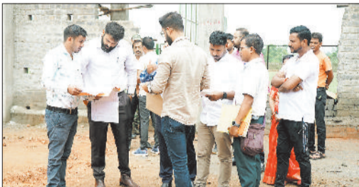
निर्माण एजेंसी को आवश्यक दिशा निर्देश देते कलेक्टर।

बच्चों स्टेडियम में बास्केटबॉल शतरंज, कैरम, टेबल टेनिस खेल सकेंगे